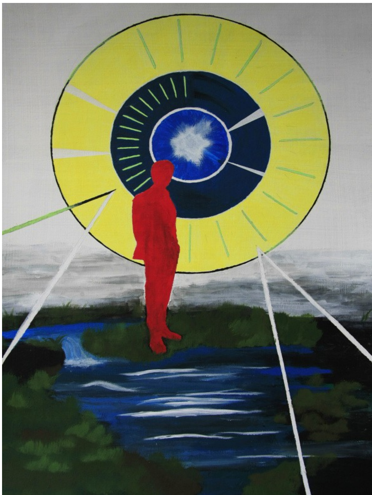
Filingerová Michaela 1. ročník