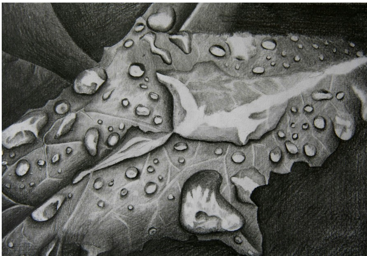
Gabriel Uhlíř 2. ročník