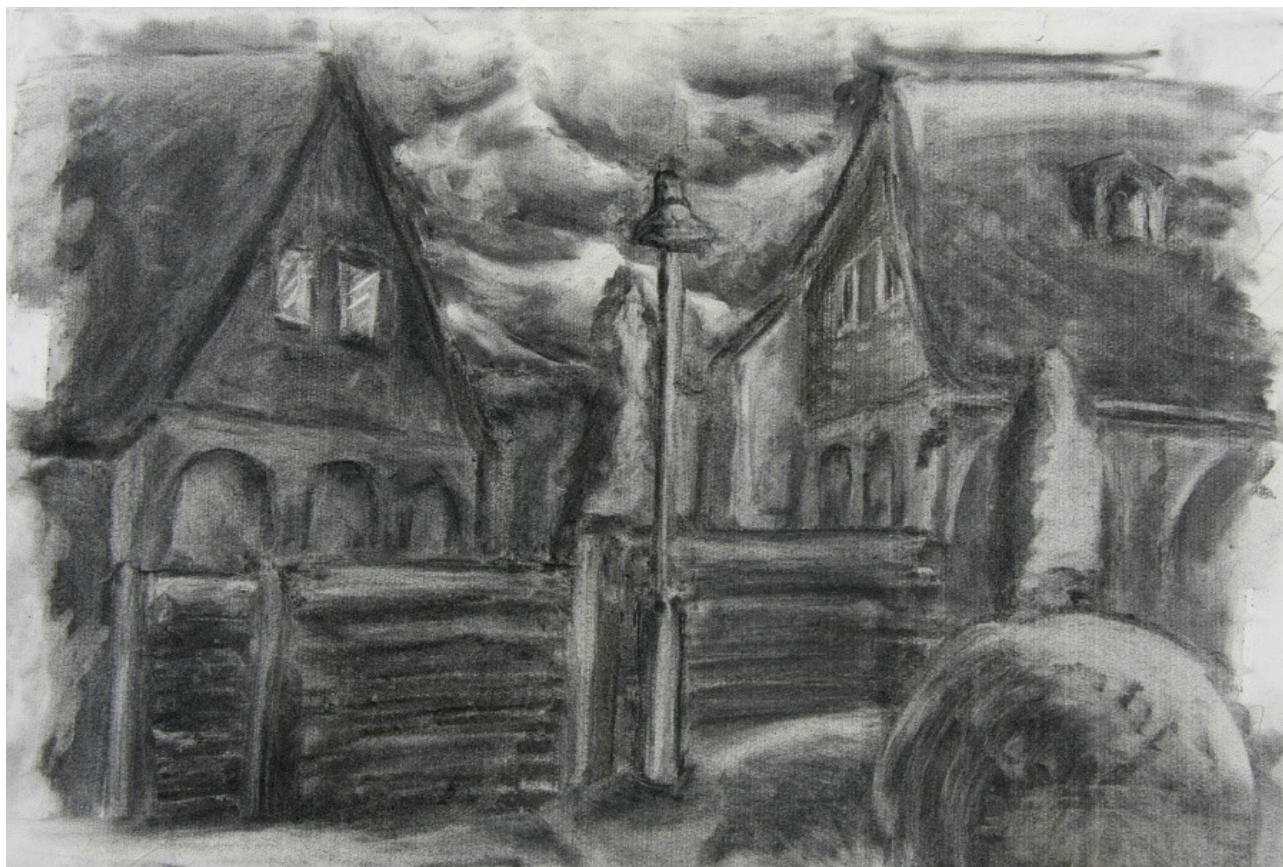
Maxmilián Paskovský 2. ročník