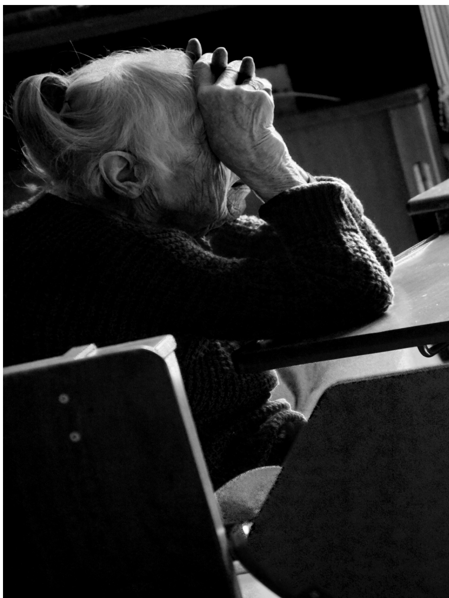
Domov důchodců ve Filipově Krajinářský kurz 2014