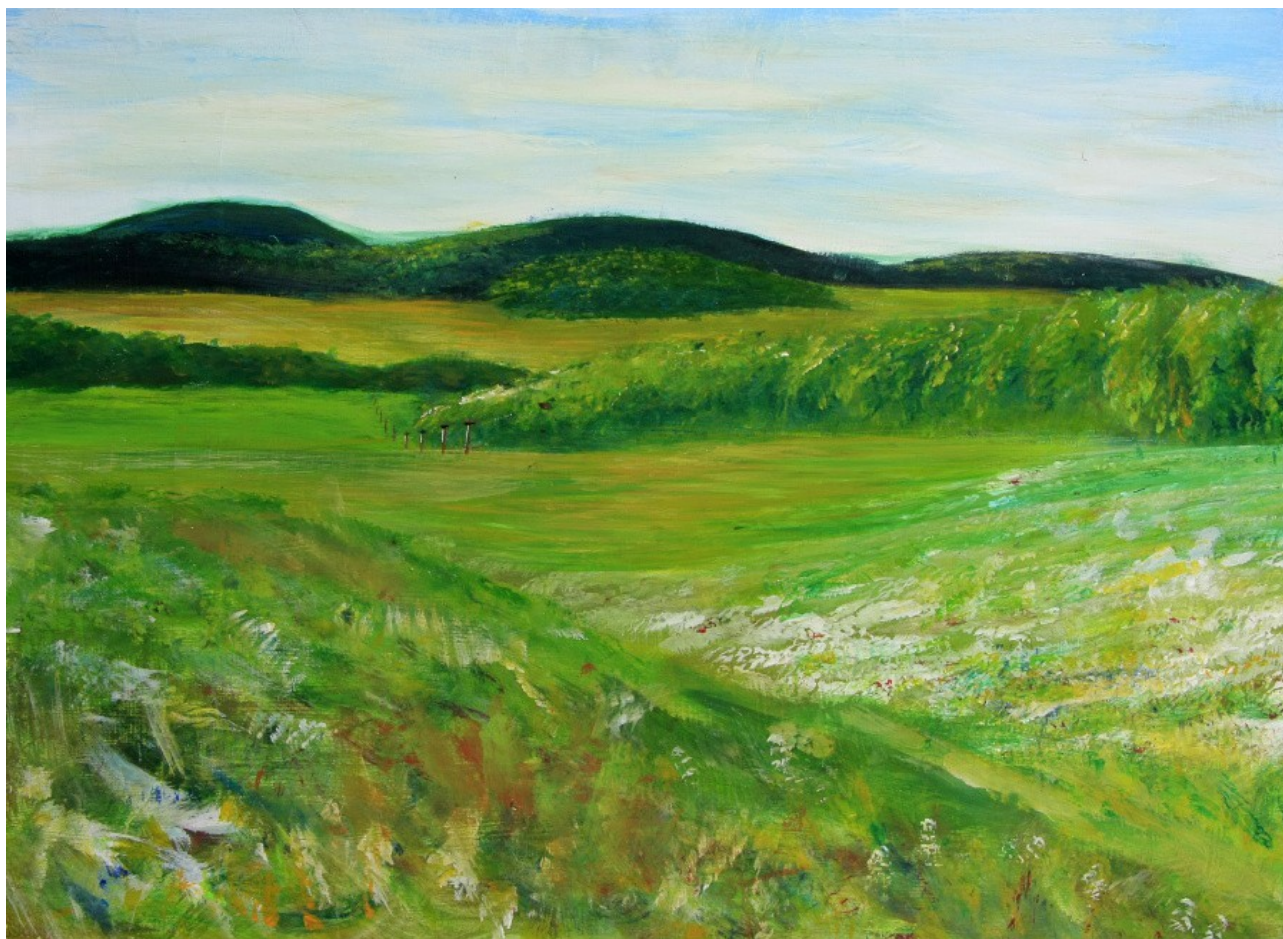
Ondřej Klavík 3. ročník Krajinářský kurz 2014