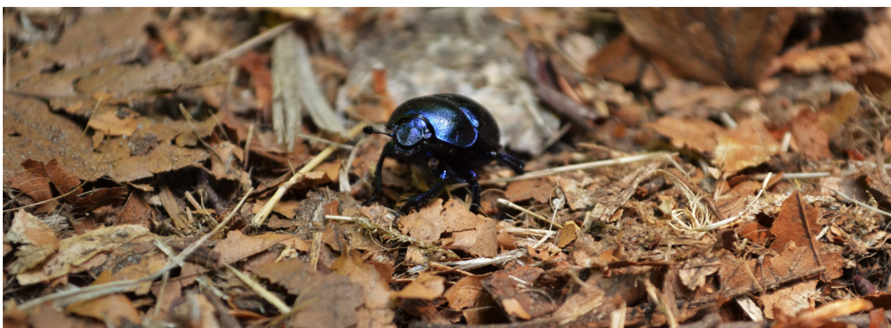
Brabec Filip 3. ročník Krajinářský kurz 2014