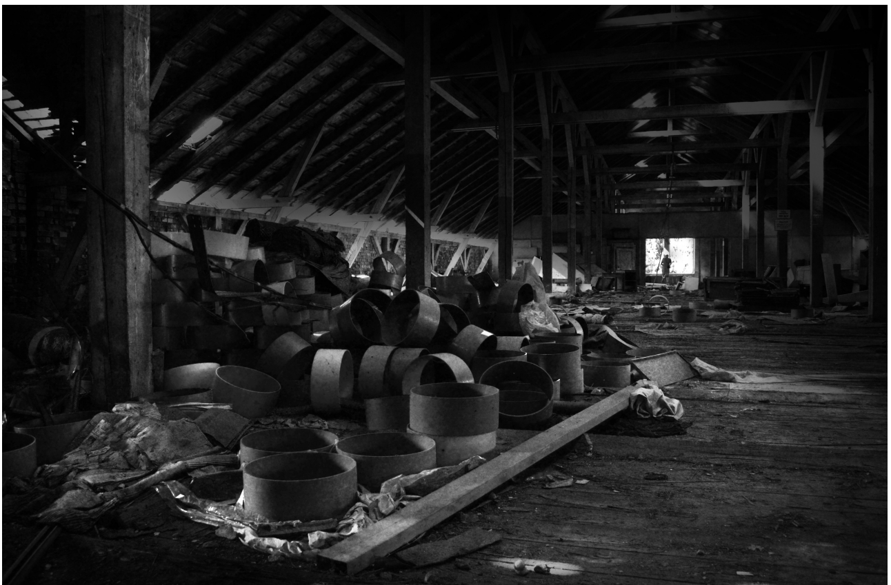
Opuštěná německá fabrika Krajinářský kurz 2014