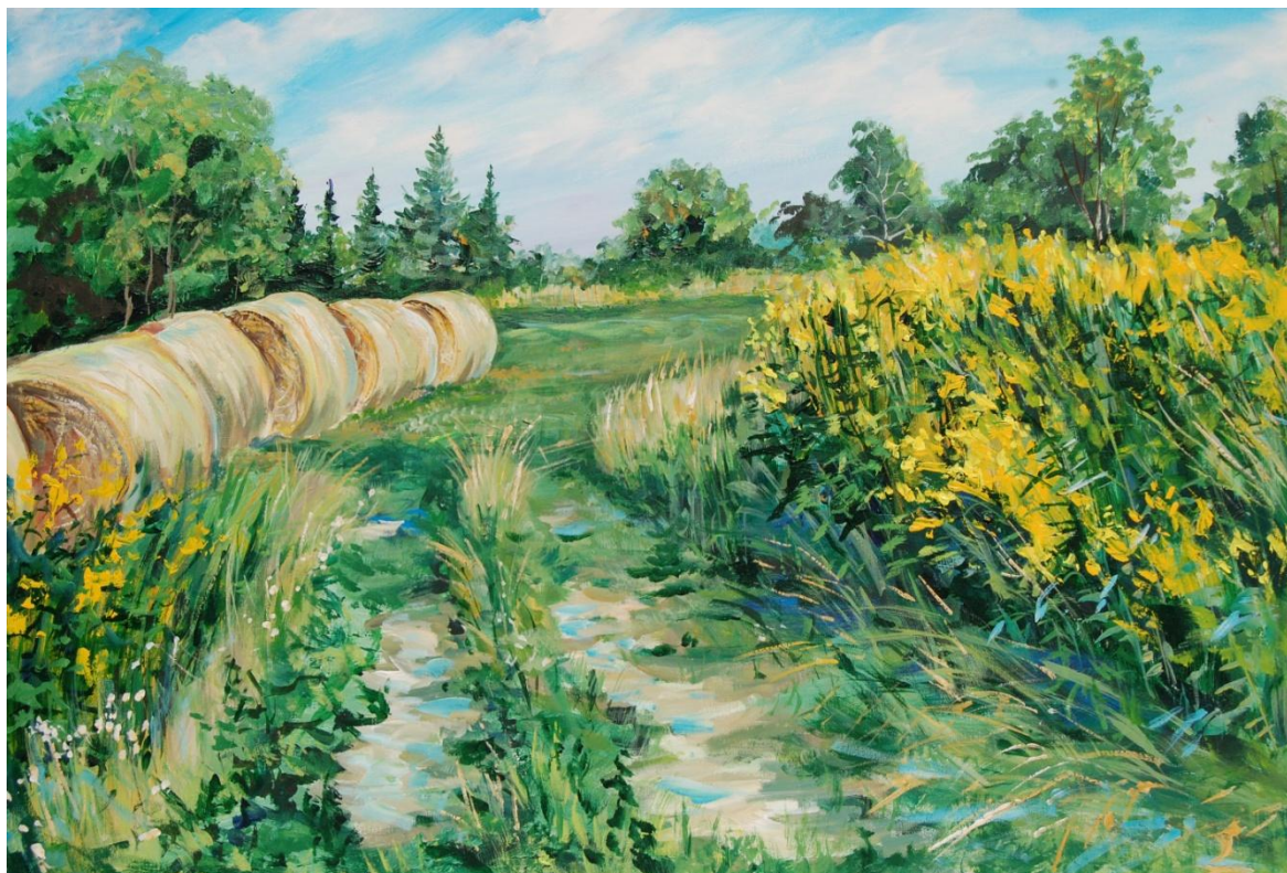
Polní cesta, Olga Yakovenko (DE UA) Česko-Německo-Polský projekt